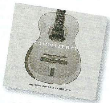
« Coincidence » (Dr Heart Music), déjà disponible